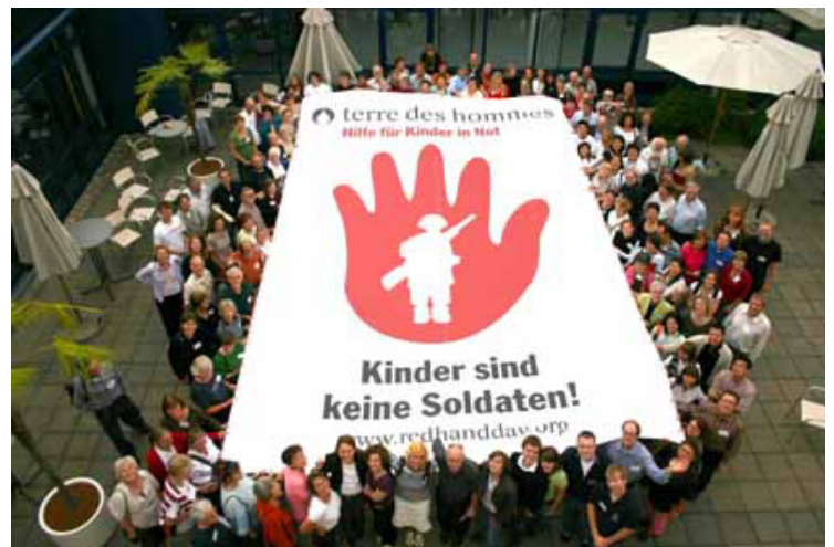
Barn er ikkje soldatar. 12. februar er ein dag for årleg markering av arbeidet for å stoppe bruk av barnesoldatar

Sjå også: www.reddbarna.no/default.asp?V_ITEM_ID=12974