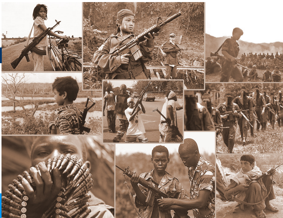
Diskuter om desse bilda gir eit dekkande bilde av omgrepet barnesoldatar.

Ein barnesoldat blir ofte oppfatta som eit valdeleg medlem av ein organisasjon som tar aktivt del i ein væpna konflikt . Omgrepet refererer imidlertid ikkje berre til uniformerte som ber våpen , men også til folk med høgst ulike roller i væpna grupper. Eksempel på slike kan vere barn som blir henta inn som kokkar, ledsagarar, berarar, barnevakter, sexslavar, livvakter, spionar, minesøkarar og arbeidarar. Barn blir sette til slike oppgåver i eit breitt spekter av væpna grupper – frå opprørarar til regjeringsstyrkar. Når slike kjensgjerningar blir tekne omsyn til, får vi eit meir dekkande bilde av kva ein barnesoldat er. UNICEF (FNs barnefond) seier det slik: «ein barnesoldat er eit barn – gut eller jente – under 18 år som med tvang, makt eller frivillig er blitt