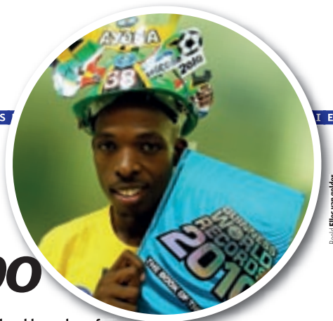
Beeld: Elles van Gelder

Volg Ngcobo via www.lastfanstanding.co.za of www.twitter.com/Ngcobo2010 ELLES VAN GELDER